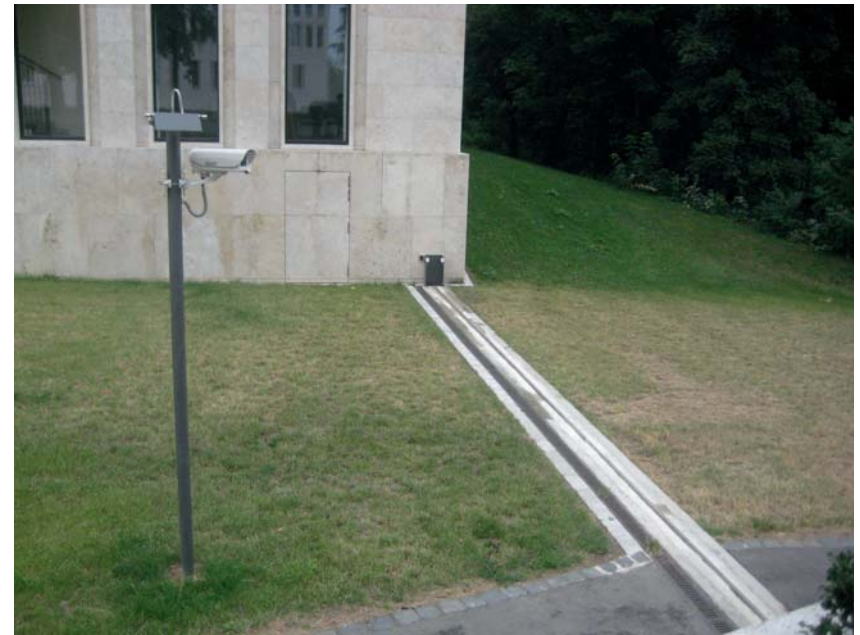
Abbildung 1 und 2